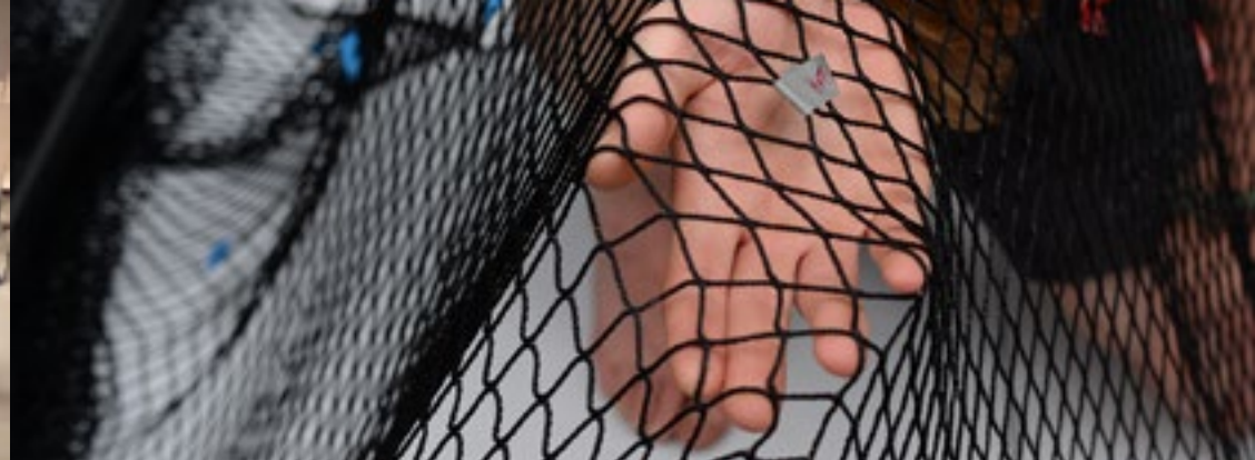
RICOJ 2015