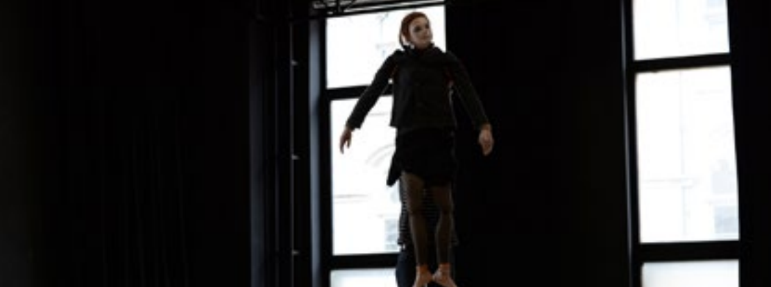
RICOI 2015