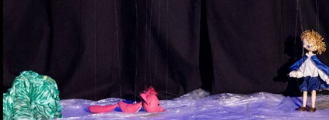
The Little Prince by Antoine de Saint-Exupéry